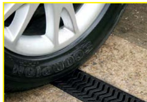
Storm Drain Plus Lijnafwatering