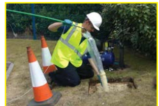
Pipe Doctor Buisreparatiesysteem

*voor meer informatie verwijzen wij u naar de desbetreffende folders.