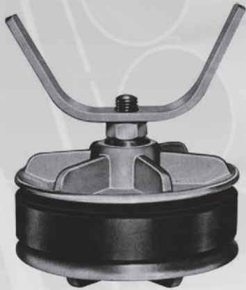
Persstop type 345 DN200