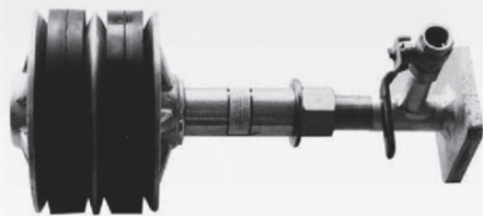
Persstop type 350